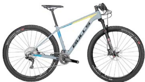
Black Adder 29