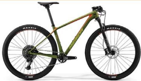
MERIDA Big.Nine 6000