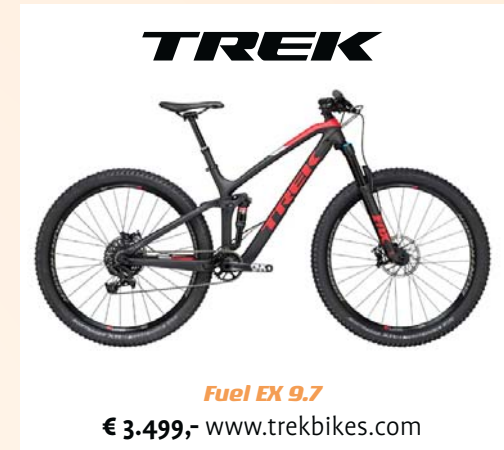
Fuel EX 9.7 € 3.499,- www.trekbikes.com