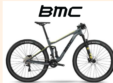
Agonist O2 Two € 3.499,- www.bmc-switzerland.com