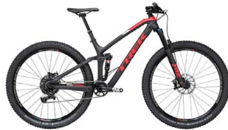
TREK Fuel EX 9.7