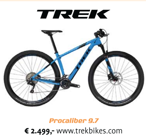
Procaliber 9.7 € 2.499,- www.trekbikes.com