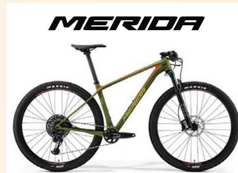
MERIDA Big.Nine 6000 € 2.649,- www.merida.nl