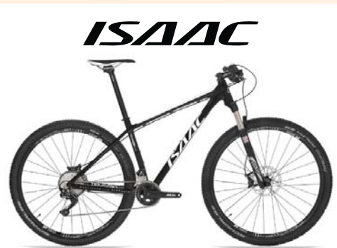
ISAAC Tensor 29 GX Eagle € 2.099,- www.isaac-cycle.com