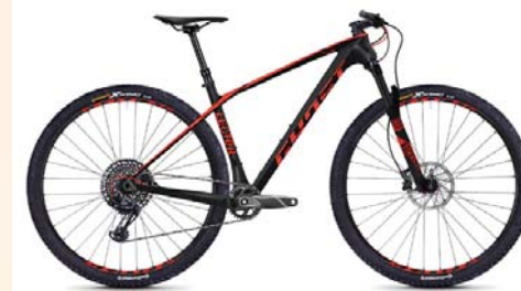
Lector 5.9 LC