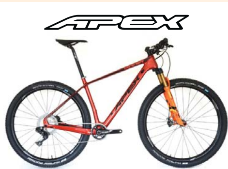
Ronin Pro XT Di2 € 4.197,- www.apex-bikes.nl